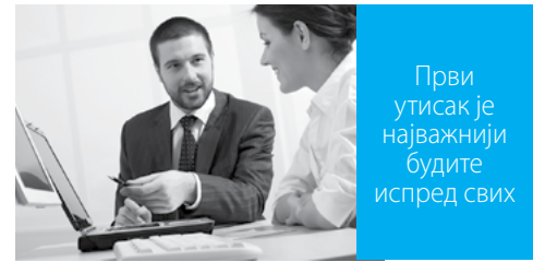
Први утисак је најважнији будите испред свих